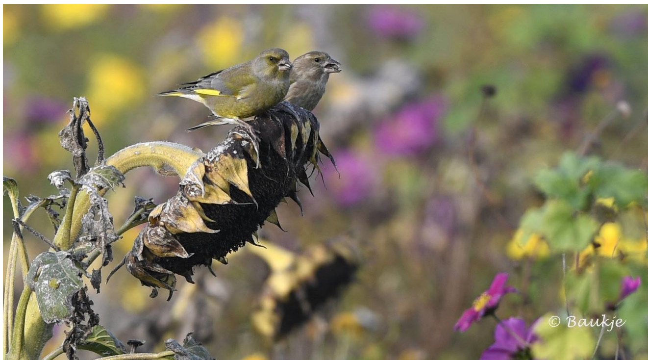
Groenling man en vrouw op zonnebloem in akkerrand

Vrijdag 4 januari Nieuwjaarsbijeenkomst Agrarisch Collectief Waadrâne